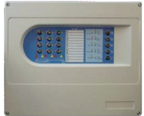
VSN LT Central convencional, modelo de 2-4-8-12 zonas.

Las centrales Vision incluyen una configuración por defecto, apta para cualquier instalación no obstante la personalización puede realizarse fácilmente. La central dispone de salida de 24V para pequeños consumos de tensión fija o rearmable. Adicionalmente, es posible la configuración para instalaciones especiales, donde no se requiera el cumplimiento de EN54.